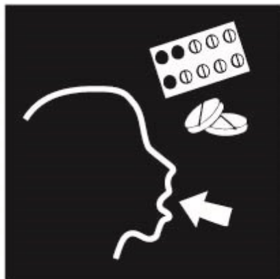
Tabletten of Zalf