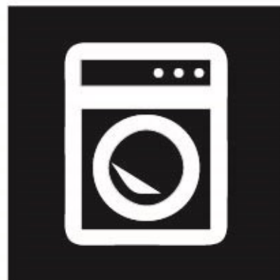
Kleding van afgelopen 72 uur in wasmachine of..