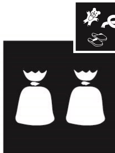
...kleding 3 dagen in zak die niet gewassen kan worden