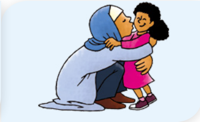
4 zoenen of knuffelen

In deze situaties hoeft u dus niet bang te zijn dat u anderen besmet.