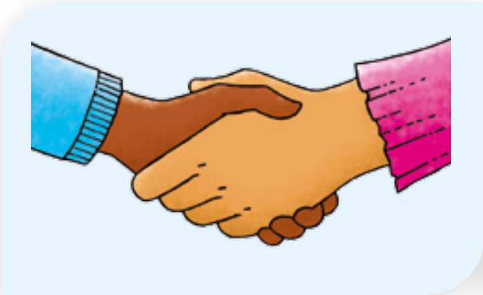
3 handen schudden